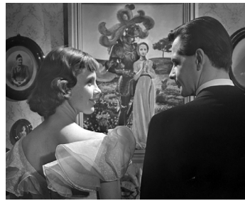
1956 LE DERNIER COUPLE QUI COURT (Sista paret ut) d'Alf Sjöberg avec Jarl Kulle