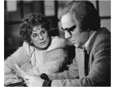
1978 AMOUR ET MARMELADE (Marmelad upproret) d'Erland Josephson avec Ulf Palme