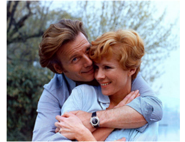
1974 LA RIVALE de Sergio Gobbi avec Jean Piat