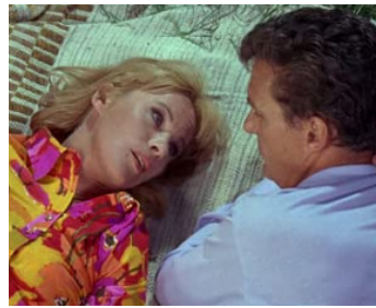
1968 L'HISTOIRE D'UNE FEMME (Storia di una Donna) de Leonardo Bercovici avec R. Stack