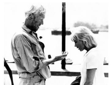
1968 LES PALMIERS NOIRS (Svarta Palmkronor) de Lars-Magnus Lindgren avec T. Berggren