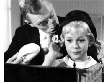
1960 JOUR DE NOCES (Bröllopsdagen) de Kenne Fant avec Max von Sydow