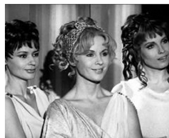
1968 LES FILLES (Flickorna) de Mai Zetterling avec Harriet Andersson, Gunnel Lindblom