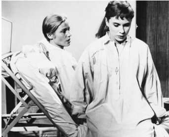
1958 AU SEUIL DE LA VIE (Nära livet) d'Ingmar Bergman avec Ingrid Thulin