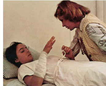
1976 JE NE T'AI JAMAIS PROMIS UN JARDIN DE ROSES d'A. Page avec Kathleen Quinlan