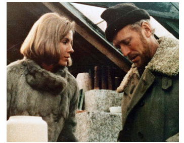
1969 UNE PASSION (En Passion) d'Ingmar Bergman avec Max von Sydow