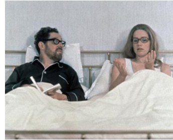
1973 SCÈNES DE LA VIE CONJUGALE (Scener ur ett äktenskap) d'I. Berman avec E. Josephson