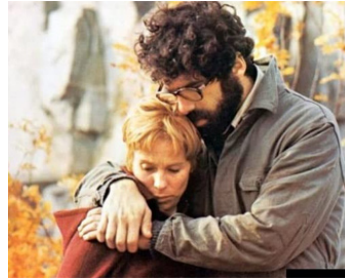
1971 LE LIEN (The Touch) d'Ingmar Bergman avec Elliott Gould