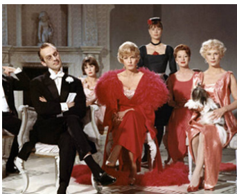
1963 TOUTES CES FEMMES (För att inte tala om alla dessa kvinnor) d'I. Bergman avec J. Kjulle