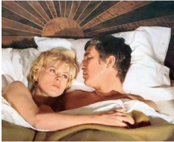
1969 LA LETTRE DU KREMLIN (The Kremlin Letter) de John Huston avec Patrick O'Neal