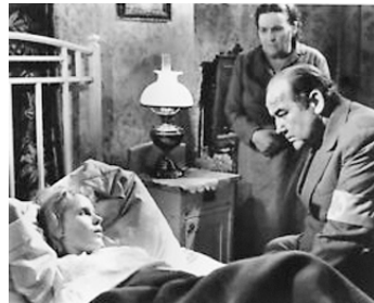
1960 LA NUIT DES OTAGES (Square of Violence) de L. Bercovici avec Broderick Crawford