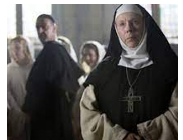
2006 ARN, CHEVALIER DU TEMPLE (Arn, tempelriddaren) de Peter Flinth