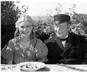
1954 UNE NUIT AU CHÂTEAU DE GLIMMINGE (En natt på Glimmingehus) de T. Wickman avec E. Persson