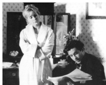
1992 QUAND TU ME REVIENDRAS ((Una estación de paso) de Gracia Querejeta avec Omero Antonutti