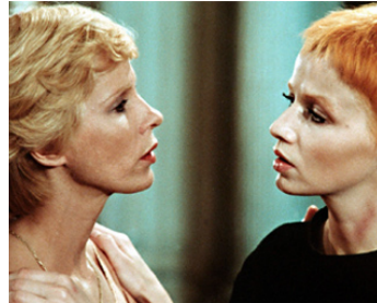
1975 BLONDY (Germicide) de Sergio Gobbi avec Catherine Jourdan