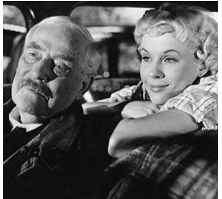
1957 LES FRAISES SAUVAGES (Smultronstället) d'Ingmar Bergman avec Victor Sjöström