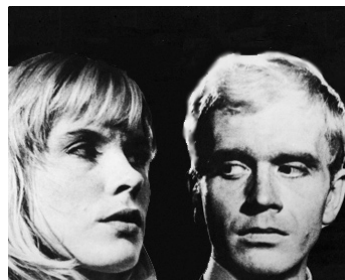
1964 L'ÎLE (Ön) d'Alf Sjöberg avec Per Myrberg