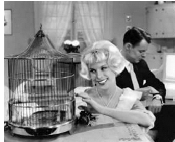
1959 LE JEU DE L'AMOUR (Den Kära Leken) de Kenne Fant avec Sven Lindberg