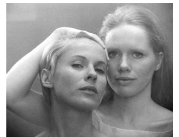
1965 PERSONA (Persona) d'Ingmar Bergman avec Liv Ullmann