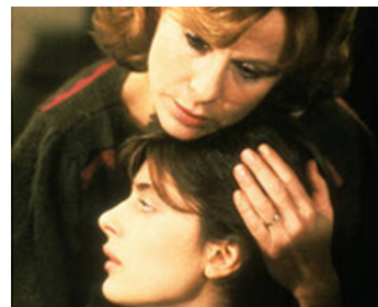
1982 SUREXPOSÉ (Exposed) de James Toback avec Nastassja Kinski