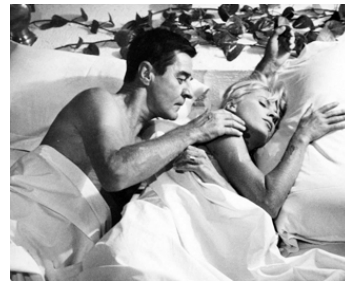
1969 LA PARTENAIRE (Violenza al sole) de Florestano Vancini avec Gunnar Björnstrand