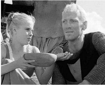
1956 LE SEPTIÈME SCEAU (Det sjunde Insegl) d'Ingmar Bergman avec Max von Sydow