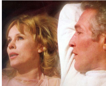
1978 QUINTET (Quintet) de Robert Altman avec Paul Newman