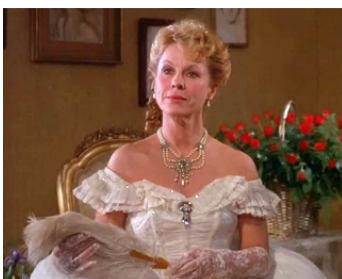
1986 LE FESTIN DE BABETTE (Babette Gæstebud) de Gabriel Axel