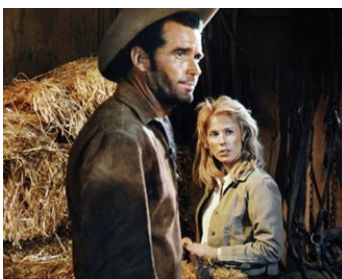
1966 LA BATAILLE DE LA VALLÉE DU DIABLE (Duel at Diablo) de R. Nelson avec J. Garner