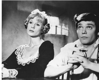
1958 LE VISAGE (Ansiktet) d'Ingmar Bergman avec Lars Ekborg