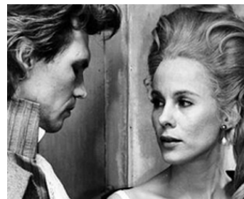
1965 MA SŒUR, MON AMOUR (Syskonbädd) de Vilgot Sjöman avec Per Oscarsson