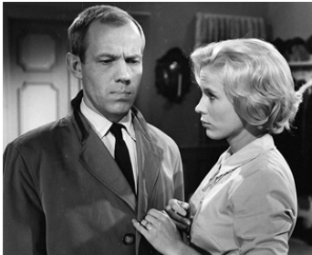
1960 L'ŒIL DU DIABLE (Djävulens Öga) d'Ingmar Bergman avec Axel Düberg