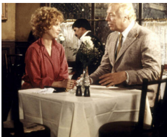
1979 AIRPORT 80 (Airport 79, the Concorde) de David Lowell Rich avec George Kennedy