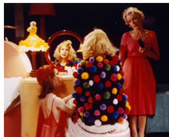
1979 INTERDIT AUX ENFANTS (Barnförbjudet) de M-L. De Geer Bergenstrahle