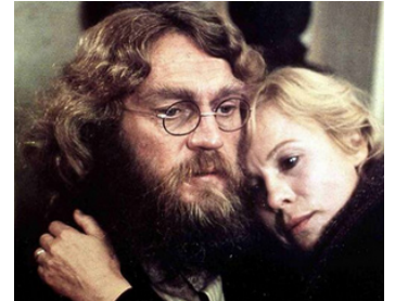
1976 UN ENNEMI DU PEUPLE (An Enemy of the People) de George Schaefer avec Steve McQueen