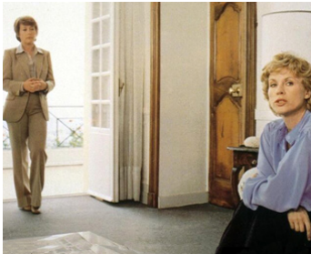
1978 L'AMOUR EN QUESTION d'André Cayatte avec Annie Girardot