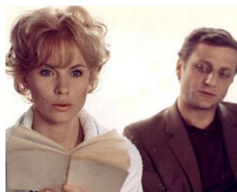
1967 LE VIOL de Jacques Doniol-Valcroze avec Bruno Crémer